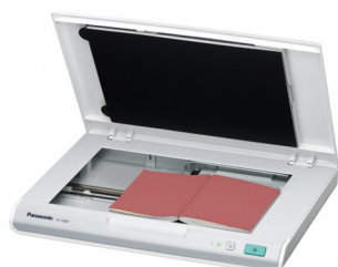
Scanner à plat (avec option KV-SS081)