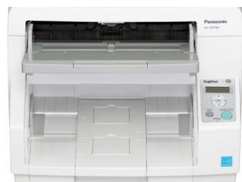
300 pages ADF